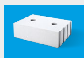
Silka – elementy uzupełniające str. 11