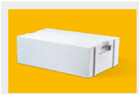
Ytong – elementy murowe str. 4, 5

Tabela dostępności elementów murowych Ytong, Silka: str. 18, 19.