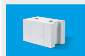
Silka – elementy murowe str. 10