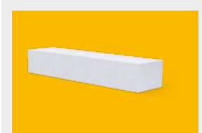
Ytong – nadproża str. 8, 9