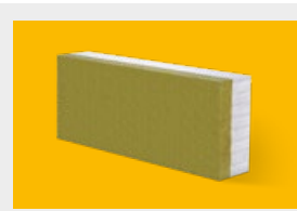
Ytong – elementy uzupełniające str. 7