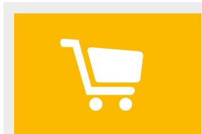
Dostępność wyrobów Ytong, Silka str. 18, 19