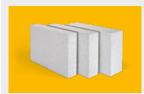
Multipor – mineralne płyty izolacyjne str. 12, 13