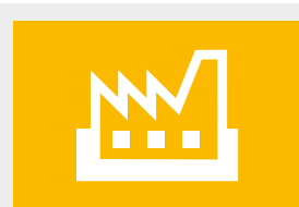
Adresy zakładów produkcyjnych str. 20