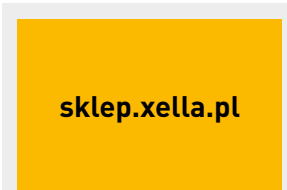
Usługi, str. 17