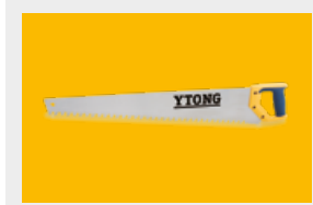
Narzędzia i akcesoria murarskie str. 14, 15