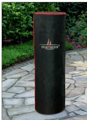
Fuora R pokrowiec