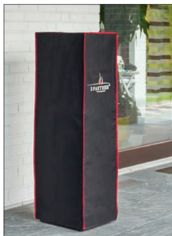
Fuora Q pokrowiec