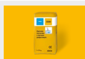
Zaprawy str. 16