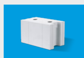
Silka – elementy murowe str. 10