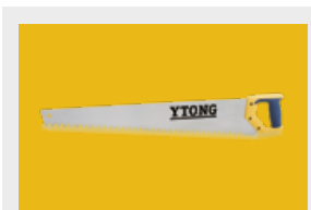
Narzędzia i akcesoria murarskie str. 14, 15