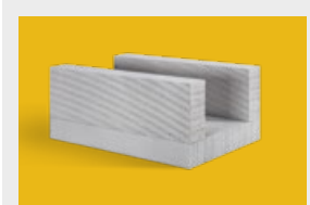
Ytong – kształtki U str. 7