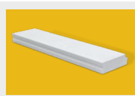
Ytong – płyty stropowe, dachowe i ścienne str. 6