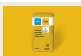
Zaprawy str. 16