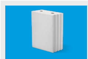
Silka Tempo – elementy murowe str. 10