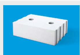
Silka – elementy uzupełniające str. 11