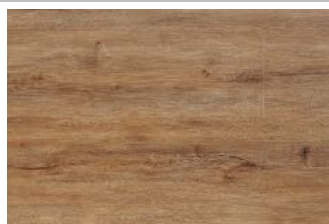
Dąb Grand Canyon